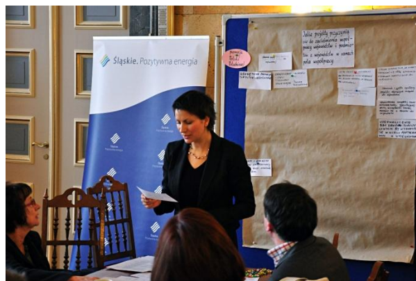
Fot. Jacek Noga