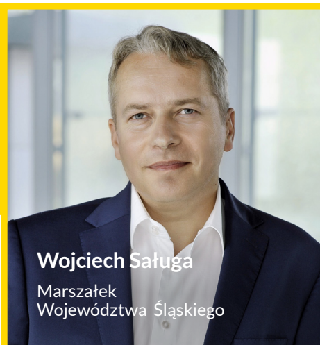
Wojciech Saługa Marszałek Województwa Śląskiego

Regionalny Program Operacyjny Województwa Śląskiego na lata 2014-2020