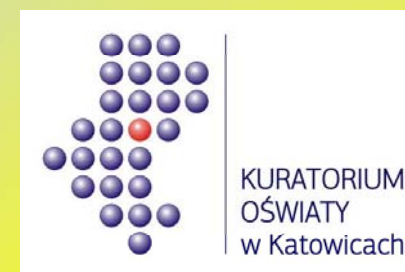
Śląski Kurator Oświaty