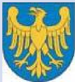
Marszałek Województwa Śląskiego