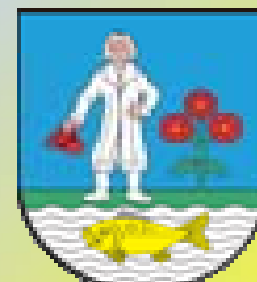
Prezydent Miasta Siemianowice Śląskie