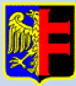
Prezydent Miasta Chorzów