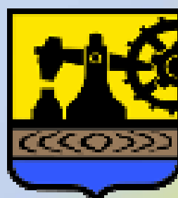
Prezydent Miasta Katowice