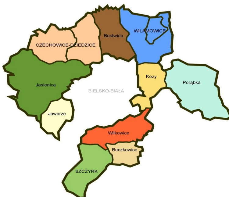
Mapa nr 2 – Gminy powiatu bielskiego

Obszar powiatu bielskiego wynosi 457 km 2 co stanowi 3,7 % powierzchni województwa śląskiego. Liczba ludności powiatu wynosi ok. 150 tys. mieszkańców czyli 3,2 % ludności województwa. Do obszaru o najwyższej koncentracji ludności należą Czechowice – Dziejdzice oraz Jasienica, najslabiej zaludnione gminy to Jaworze i Szczyrk. Strukturę administracyjną powiatu tworzy 10 gmin, w tym: 1 gmina miejska, 2 gminy miejsko-wiejskie oraz 7 gmin wiejskich. Powiat bielski należy do grupy powiatów ziemskich „owiniętych” wokół miast na prawach powiatów (powiatów grodzkich) – Bielska - Białej.