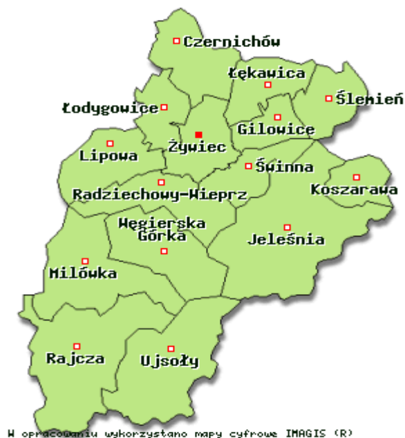
Mapa nr 3 – Gminy powiatu żywieckiego

Potencjał gospodarczy powiatu żywieckiego jest zróżnicowany. Największe przedsiębiorstwa usytuowane są w Żywcu np. „Grupa Żywiec”, „PONAR” Żywiec (fabryka maszyn i urządzeń), „FAMED” S.A. – fabryka sprzętu szpitalnego, „HUTCHINSON” Sp. z o.o. Na terenie całego powiatu dobrze rozwija się drobna wytwórczość, rzemiosło, usługi oraz handel. Poza wielkimi pracodawcami, najwięcej miejsc pracy, zwłaszcza sezonowo, tworzonych jest w branży turystycznej. Dla tak rozległego powiatu, o dużym potencjale turystycznym, ma to bardzo istotne znaczenie w aspekcie gospodarczym i społecznym.