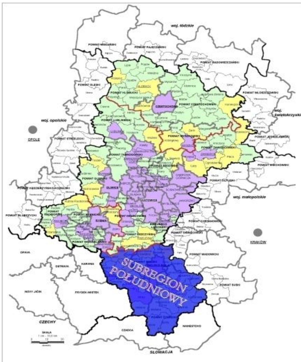
Mapa nr 1 – Subregion południowy na tle województwa śląskiego

Subregion południowy województwa śląskiego zajmuje obszar 2 352 km 2 , co stanowi ok. 19 % powierzchni województwa. Zamieszkiwany jest przez 647 522 mieszkańców (13,8% ogółu ludności województwa). Obszar ten zorganizowany jest wokół aglomeracji bielskiej, która z innymi miastami obszaru (Cieszyn, Czechowice – Dziedzice, Żywiec, Skoczów, Ustroń, Szczyrk i Wisła) powiązana jest międzyregionalną i regionalną siecią transportową.