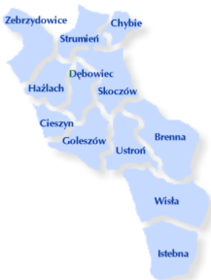
Mapa nr 4 – Gminy powiatu cieszyńskiego

Turystyka w powiecie cieszyńskim stanowi jedną z najważniejszych dziedzin gospodarki, będąc istotnym i wiodącym źródłem dochodów i tym samym miejscem zatrudnienia wielu mieszkańców. Ponadto w dziedzinie przemysłu dominują: przemysł chemiczny, elektromaszynowy, spożywczy. Ważną rolę odgrywa również handel i usługi.