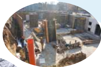
Rośnie, rośnie WNS...