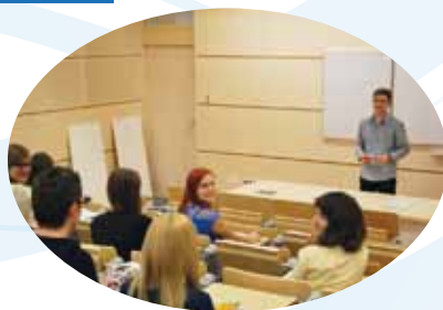
Sala wykładowa Wydziału Nauk Społecznych