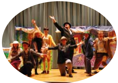
Studenci AJD: oficjalnie i w trakcie występu