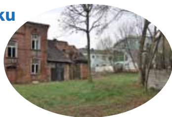
Kiedyś były tu stare budynki, teraz na tej działce będzie stał nowoczesny gmach WNSu