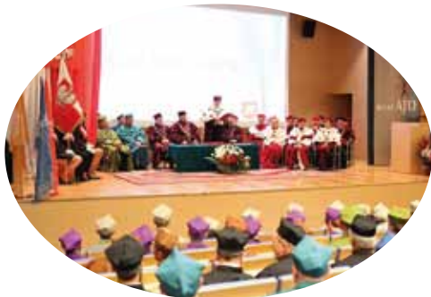
Aula Wydziału Nauk Społecznych przy al. Armii Krajowej 13/15