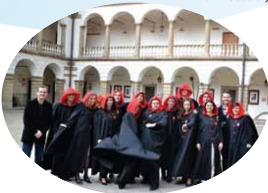
Chór Akademicki AJD