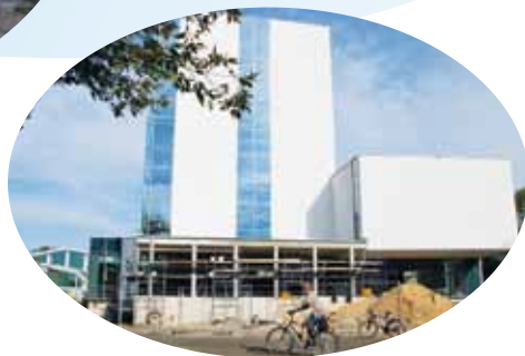
Wejście główne (WNS ściana południowa)