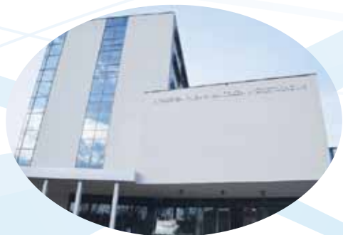
Główne wejście do Wydziału Nauk Społecznych