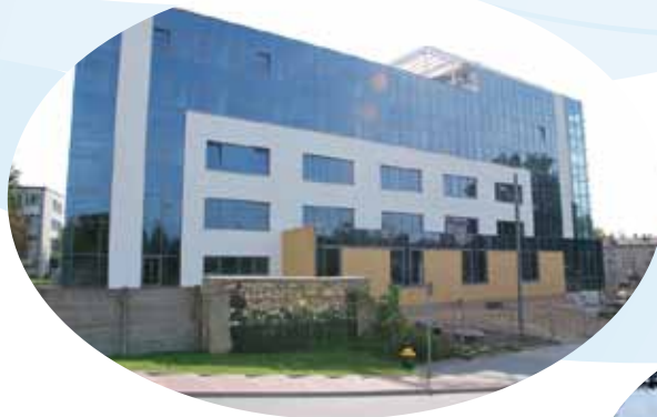
WNS- ściana zachodnia

Okres rzeczowej realizacji projektu: lata 2011 -2012