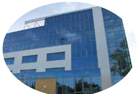
Nowoczesna technologia to wyzwanie XXI wieku

Mówi się, że pieniądze z UE zmieniają Polskę? Trzy lata temu m. in. za pieniądze z projektu została przebudowana nowoczesna aula właśnie z przeznaczeniem dla Wydziału Nauk Społecznych. Jak ten obiekt jest wykorzystywany?