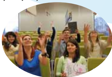
Budynek nam się podoba!